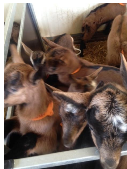
Les chevreaux 2022 : la zizanie en attendant les biberons

En cuisine, le lait cru s'utilise exactement comme vous en avez l'habitude. Une exception tout de même si vous faites vos yaourts maison. Il faudra faire bouillir le lait cru avant, sans quoi les bactéries du lait risquent d'empêcher les bactéries à yaourt de se développer correctement. La concurrence serait trop rude !