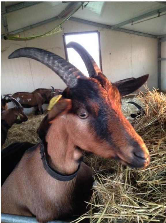
Santoline, l'aînée du troupeau

Les chevrettes, nées en février 2021, sont bien arrivées à Toussacq fin juin. Elles ont pris leurs quartiers dans un poulailler vide de la ferme. Gestantes depuis septembre, elles mettront bas d'ici quelques semaines. La saison du fromage sera alors officiellement ouverte et nous aurons le plaisir de faire nos premières livraisons AMAP dès mars.